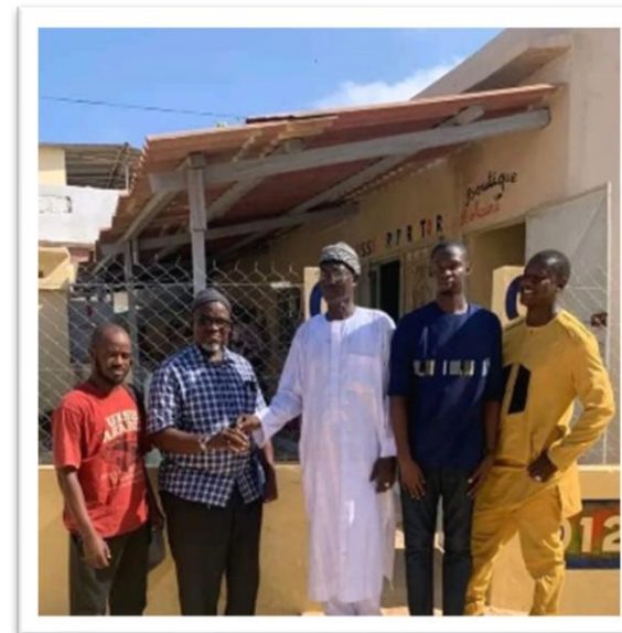
Réception des locaux CPE de Ouakam