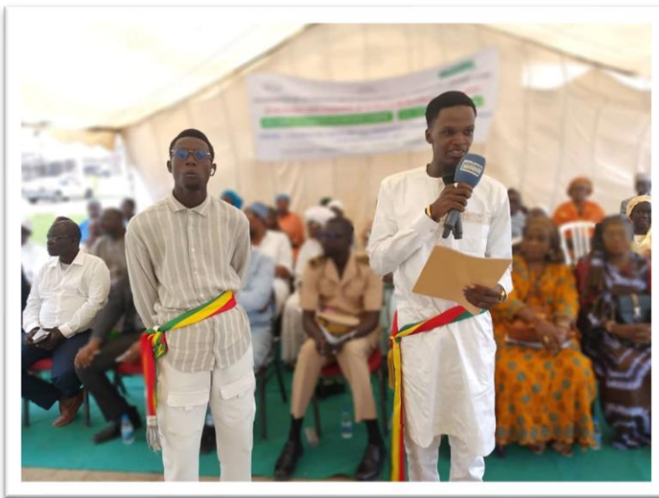
Communication des maires jeunes des deux CMJ