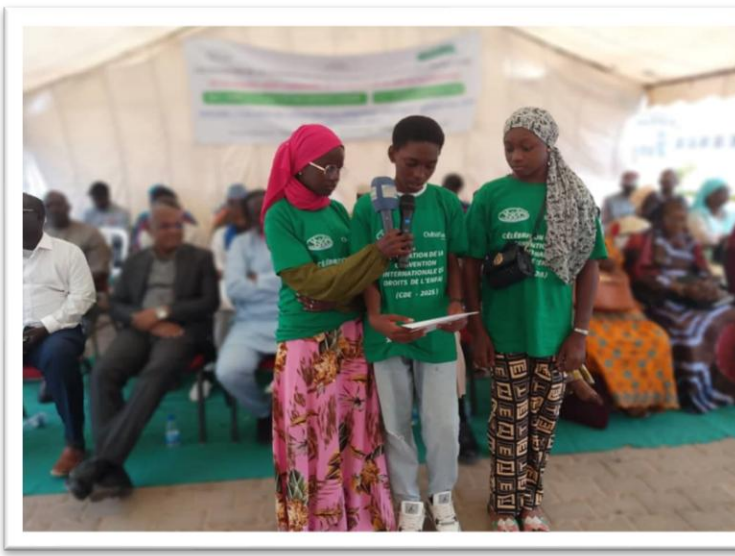
Discours du représentant des jeunes