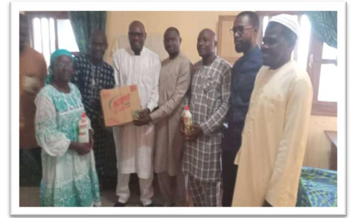
Cérémonie de remise de don de kits d'hygiène et de rames de papier aux écoles élémentaires et aux structures DIPE à Sébikotane